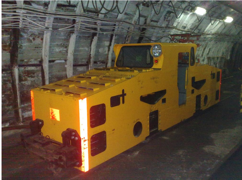
Rys. 2. Zmodernizowana lokomotywa Ld-31EM w KWK „Piast” [2]

Poniżej przedstawiono zmiany wprowadzone w układzie elektrycznym lokomotywy oraz ich wpływ na jej eksploatację.