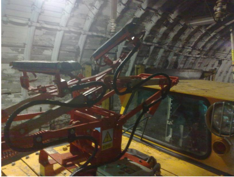
Rys. 7. Uszkodzenie odbieraka prądu [2]

Podczas pracy lokomotywy Ld-31EM nie stwierdzono zadziałania zabezpieczeń stromości narastania prądu w sieci kopalnianej. Uzyskano to za pomocą dodatkowych rezystorów zabudowanych w modułach przekształtnika energoelektronicznego lokomotywy, które umożliwiają wstępne naładowanie kondensatorów. Dodatkowo, wprowadzone sekwencyjne załączanie styczników zasilających moduły przekształtników, spowodowało ograniczenie stromości narastania prądu podczas uruchamiania lokomotywy.