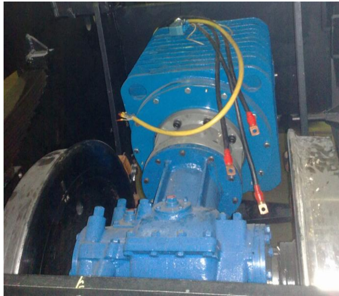
Rys. 3. Zestaw napędowy lokomotywy [2]

Zmniejszenie mocy silników umożliwiło zastosowanie innych podzespołów wyposażenia elektrycznego w zespole zasilania i modułów przekształtnika energoelektronicznego. Zastosowano m. in. nowoczesne styczniki prądu stałego oraz dławik prądu stałego o mniejszych gabarytach i większej sprawności. Ponadto, wszystkie bezpieczniki zabudowane w zespole zasilania wyprowadzono do wnętrza kabiny operatora. Łatwy i wygodny dostęp do wkładek bezpiecznikowych znacznie poprawił funkcjonalność użytkowania lokomotywy. Dostęp do bezpieczników umożliwia specjalna pokrywa z wizjerem (rys. 4).