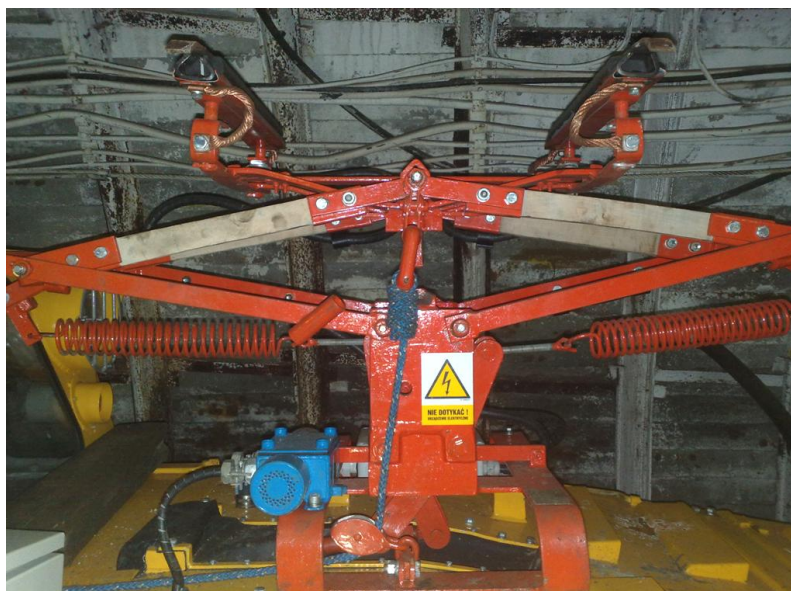
Rys. 6. Odbierak prądu [2]

Kolejną zmianą w stosunku do pierwszego egzemplarza lokomotywy jest odbierak prądu (rys. 6), służący do bezpiecznego przekazywania energii elektrycznej z przewodu trakcyjnego do maszyny. W pierwszej wersji zastosowano jedyny oferowany na rynku odbierak prądowy, produkcji niemieckiej, spełniający wymagane parametry. Wadą tego rozwiązania było znaczne ograniczenie pola widzenia operatora lokomotywy oraz brak możliwości ręcznego, mechanicznego opuszczania, jak również jego wysoki koszt, co miało bezpośrednie przełożenie na cenę lokomotywy. Firma Energo-Mechanik Sp. z o.o. zdecydowała się na opracowanie odbieraka prądu własnej konstrukcji.