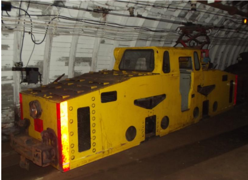
Rys. 1. Pierwszy egzemplarz lokomotywy Ld-31EM w KWK „Piast” [2]

Okres rocznej eksploatacji lokomotywy Ld-31EM w Kopalni Węgla Kamiennego „Piast” (rys. 1) pozwolił na zebranie doświadczeń przez użytkowników, producenta i konstruktorów.