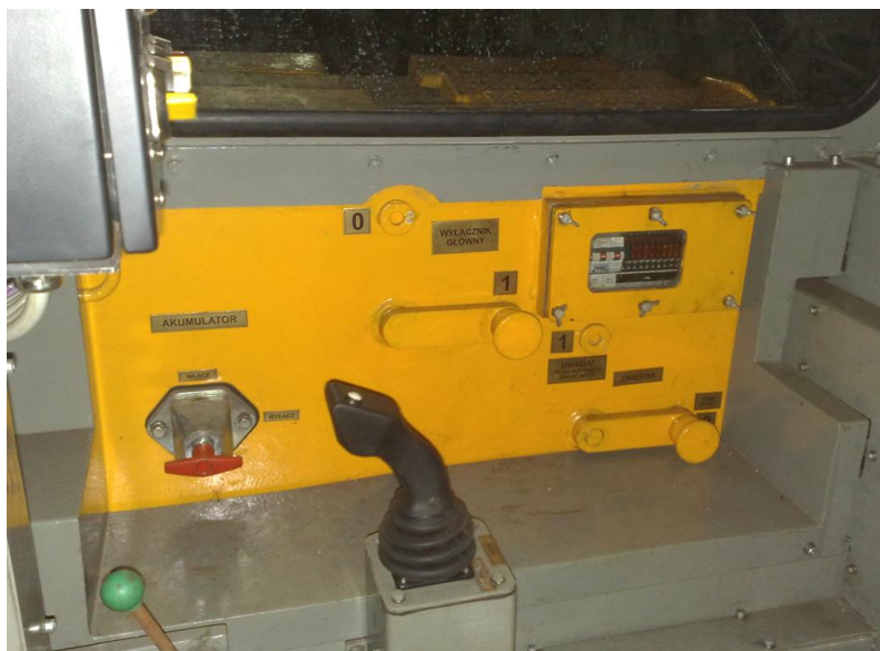
Rys. 4. Wnętrze kabiny lokomotywy [2]

Zmniejszenie mocy silników umożliwiło zastosowanie innych podzespołów wyposażenia elektrycznego w zespole zasilania i modułów przekształtnika energoelektronicznego. Zastosowano m. in. nowoczesne styczniki prądu stałego oraz dławik prądu stałego o mniejszych gabarytach i większej sprawności. Ponadto, wszystkie bezpieczniki zabudowane w zespole zasilania wyprowadzono do wnętrza kabiny operatora. Łatwy i wygodny dostęp do wkładek bezpiecznikowych znacznie poprawił funkcjonalność użytkowania lokomotywy. Dostęp do bezpieczników umożliwia specjalna pokrywa z wizjerem (rys. 4).